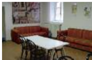
Interni della Casa.