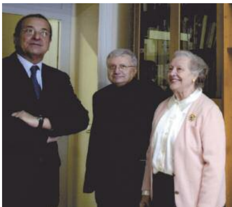
Il Prefetto con il Vicario Generale e la Presidente.

ze ospiti della casa d'accoglienza e la sala dove mangiano tute insieme, complimentandosi con i volontari del centro per l'attività svolta. "Il vostro impegno è lodevole perché non "dovete" fare, ma "volete" fare: questo atteggiamento vi ha permesso di rispondere con serietà alle esigenze e alle richieste del territorio. L'investimento che fate nei confronti dei giovani è la prova tangibile di quanto vi interessi il loro futuro."