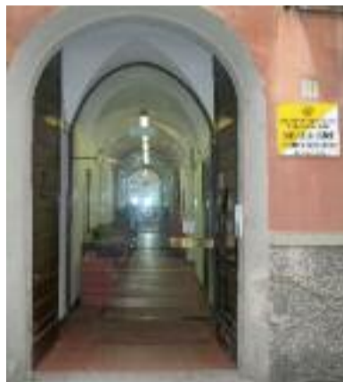
Ingresso della Casa.

Solo allora un travaso di valori dagli uni agli altri farà dell'integrazione una esperienza di grande spessore e di grande valore culturale e sociale, creando nella nostra Comunità un clima