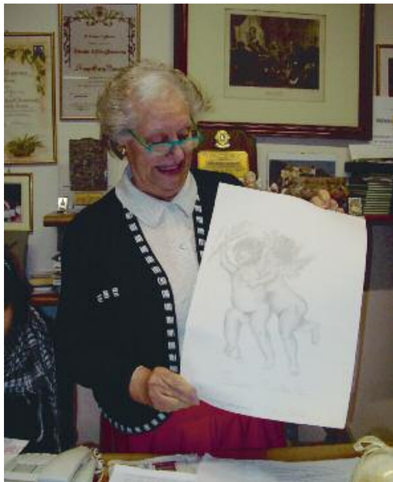
La Presidente mostra i "lavori" premiati.

poesia presentazione dell'Associazione a fumetti